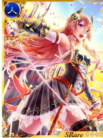
CM 放映記念キャンペーンでもらえる 限定「Sレアカード」 - 『薔薇姫マーガレット』

今回、新 CM 放映を記念して実施されるキャンペーンでは、放映期間中に『神獄のヴァルハラゲート』にログインした方全員に、ログインボーナスとしてレアリティの高い限定「Sレアカード」を最大 5 枚プレゼントします。また、5 回目のログインでは、新機能として追加された「アクセサリ」もプレゼントします。 ※本キャンペーンは CM 放映開始日の、3 月 20 日 17:30 より開始予定です。